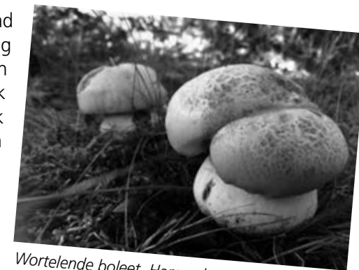
Wortelende boleet, Hammeler weg Leuvenheim, augustus 2016.

De bodem heeft dus de tijd gehad om zich te ontwikkelen. En er is nog iets. Omdat de bodem zo nat en zompig was, zijn de wegen vaak op dijkes aangelegd. Dat geldt ook voor de Hammelerweg. De wind en zwaartekracht zorgen er dan voor dat bladeren van de bomen van het dijke worden gewaaid. Daardoor is de berm schraal, arm aan voedingstoffen. En dat is weer prima voor vele soorten paddenstoelen. Ga snel kijken!