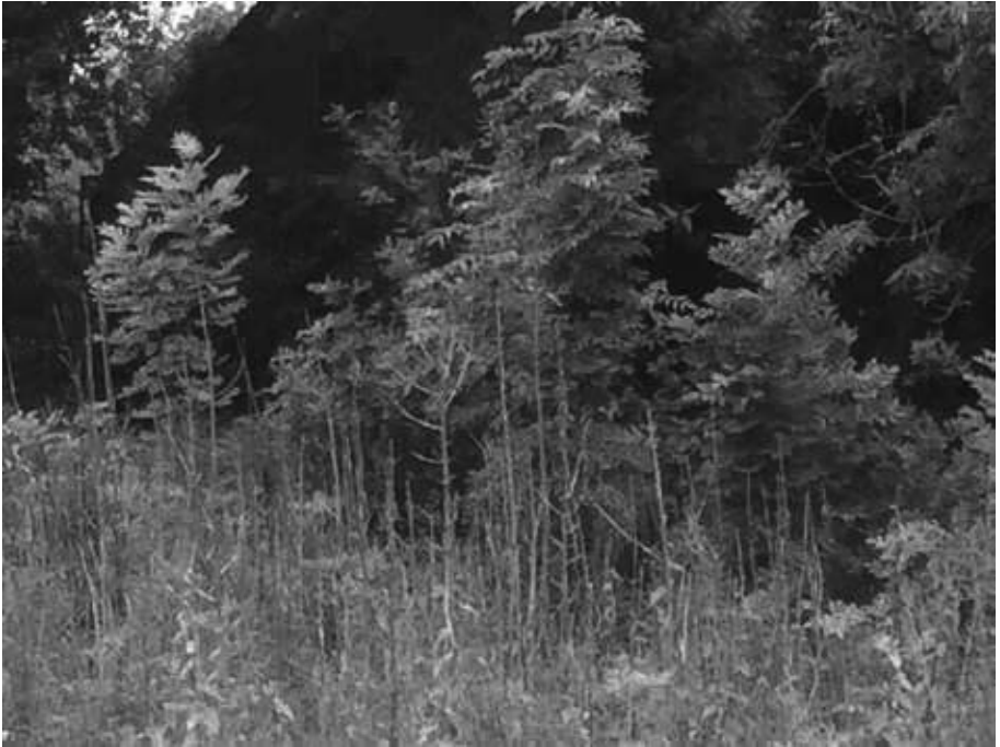
Dode en vitale jonge essen langs de Spankerenseweg.